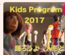
Kids Program 2017 踊らうよ 人形と♪